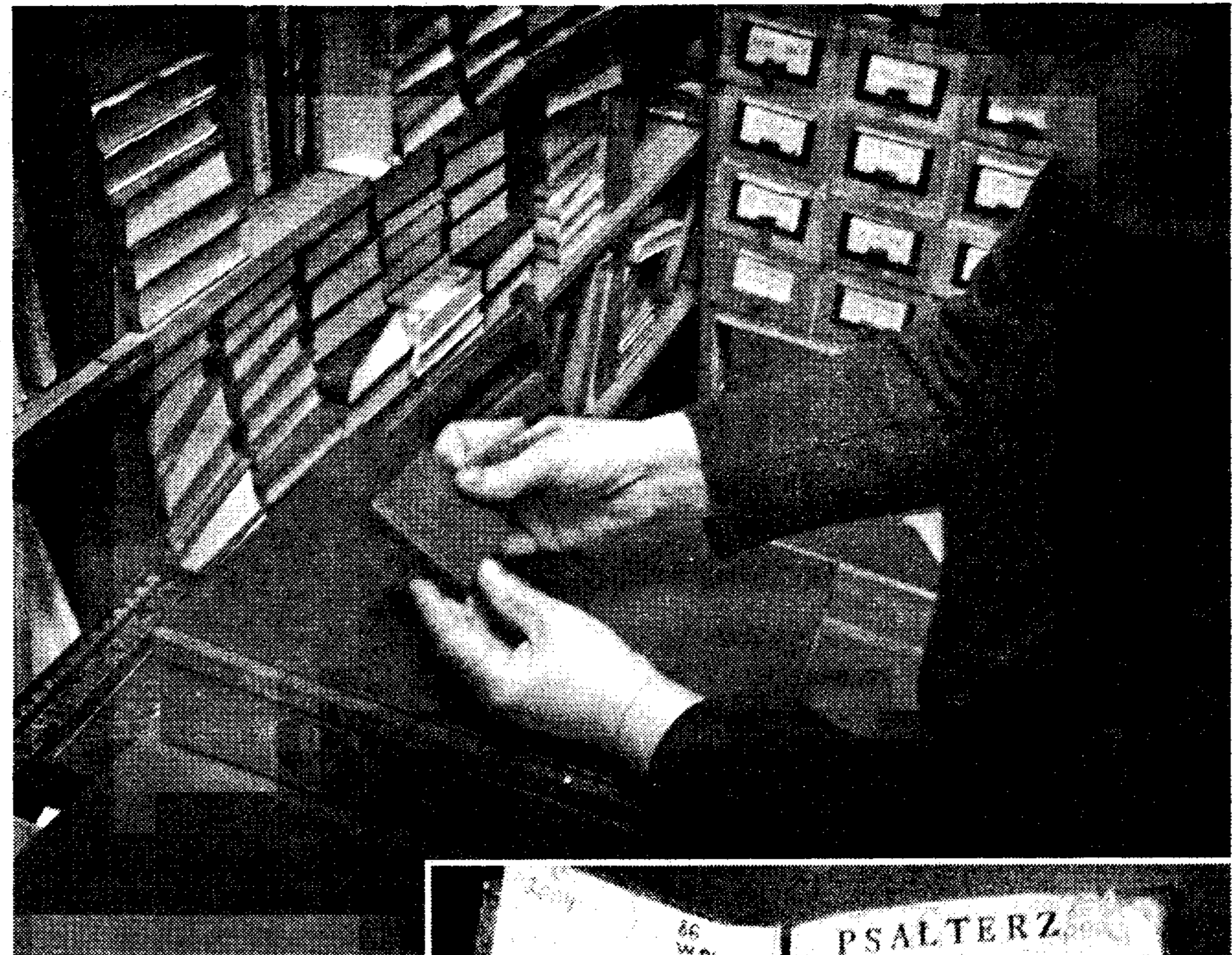
Найбільшою в Тернополі книгою є "Ізборник Святослава 1073 року"

430 років незабаром виповниться найстарішій у нашому місті книзі "Біблії польській", а найдорожча книжка Тернополя коштує майже тисячу гривень